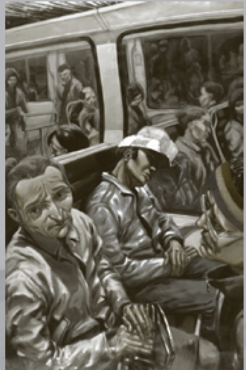
Déphasés , glycéro sur papier - 230 x 150 cm en fond : Portrait , huile - 50 x 70 cm

Parallèlement, il publie dans divers fanzines des planches de bandes dessinées. Il s'auto-édite en 1996 dans Lieux Communs (2), un recueil de séquences délivrant une approche sociologique sur l'urbanisme et la population des banlieues. En 2004, sort l'album Otaku (3), fiction spéculative réalisée en collaboration avec le scénariste Lionel Tran.