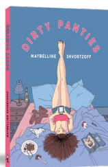
DIRTY PANTIES (ÉDITION ANGLAISE) ISBN 9782848410753