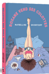
ROXANE VEND SES CULOTTES ISBN 9782848410685